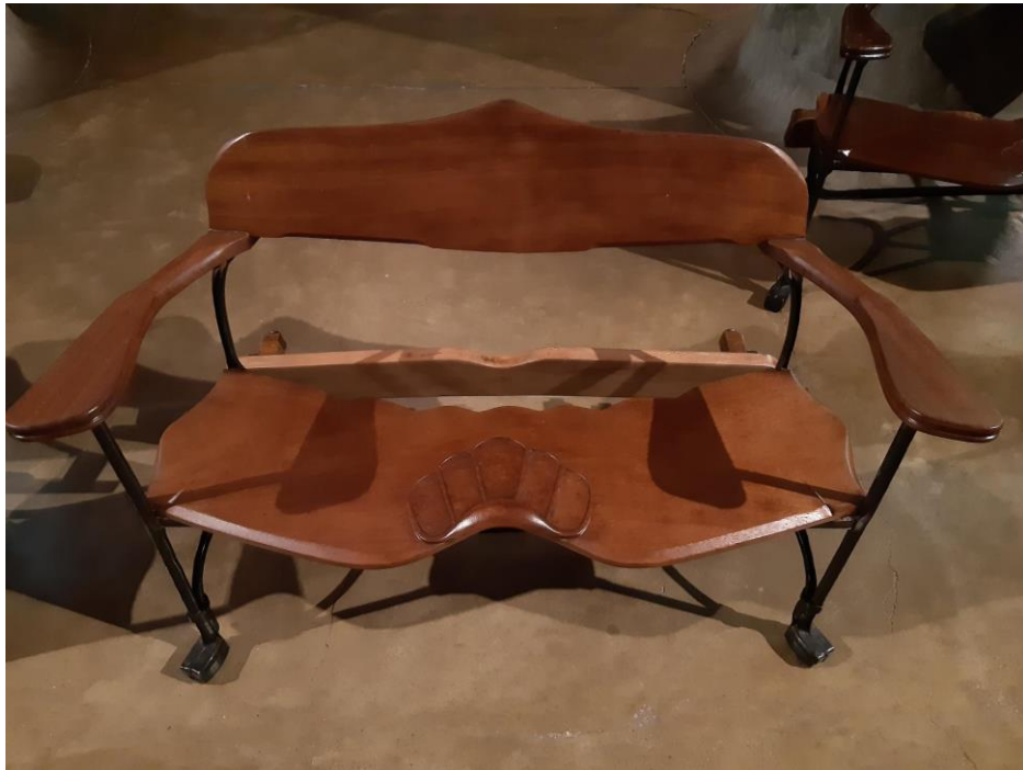
Imatge d'un banc restaurat