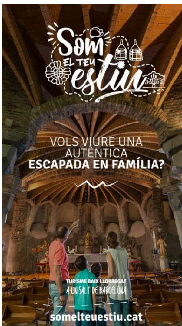
Imatge de la campanya promocional

Cal destacar que tant l'empresa ALS, que gestiona el servei de visites, com el propi Consorci, participen i col·laboren de manera activa en aquestes accions de difusió conjunta de diferents recursos turístics de la comarca, sent les accions més destacades els cupons familiars de descompte (dins la campanya a un salt de Barcelona), l'elaboració de la Guia de l'Oci o la campanya del SuperMes, tot i que l'edició de l'any 2020 es va haver de suspendre per la pandèmia.