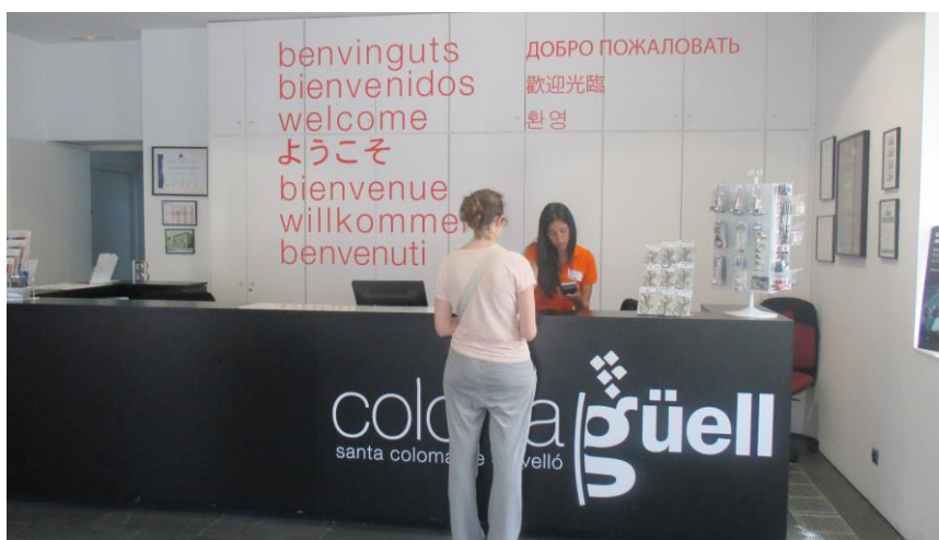
Imatge del punt de recepció de les persones visitants