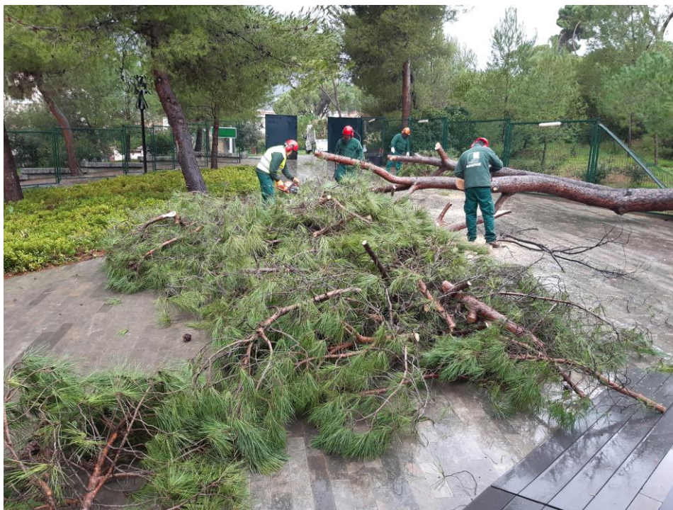
Imatge del pi caigut dins del recinte de l'església

A partir de l'1 de gener es va fer l'adjudicació del nou servei de jardineria, mitjançant un contracte de serveis reservat a centres especials de treball d'iniciativa social. La licitació es va adjudicar a la Fundació Privada Gaspar de Portolà, que es un centre especial de treball per a persones amb discapacitat, que va ser l'entitat que va presentar l'oferta més avantatjosa.