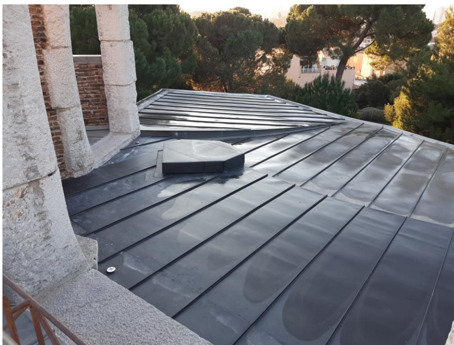
Imatge de l'obra de substitució de la planxa de zinc

A més d'aquesta obra s'ha realitzat una actuació de millora dels focus d'il·luminació exterior de la zona d'intervenció amb l'obra de substitució de la làmina de zinc, on s'ha fet la substitució dels vuit focus per un nou model que s'ajusta a la normativa actual i garanteix un