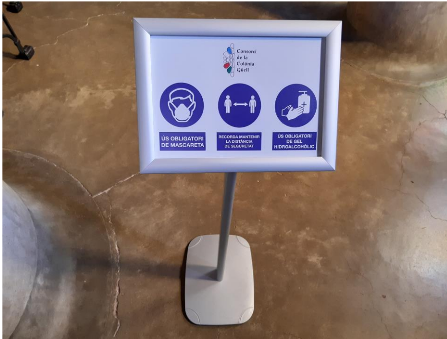
Imatge dels cartells de les mesures Covid-19 a l'interior de l'església

Del conjunt d'actuacions del Consorci i del context en que s'han desenvolupat es fa una descripció sintètica tot seguit.