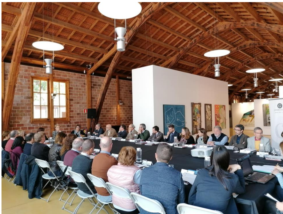
Imatge de la reunió ordinària celebrada a la Nau Gaudí de Mataró

Respecte al seminari anual, es va realitzar la sisena edició el 14 de desembre, centrat en la situació del patrimoni cultural davant la crisi de la Covid-19, celebrat en format webinar.