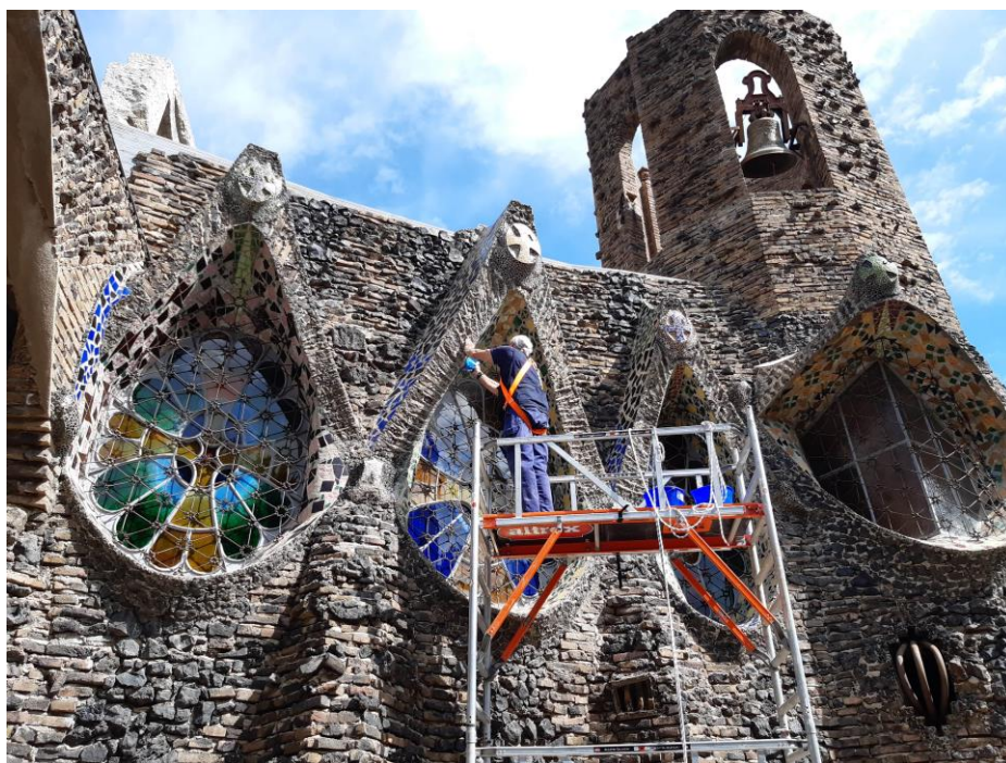
Imatge de la neteja dels finestrals de la Cripta

Al mes de juny es va fer la neteja dels mosaics exteriors, dels vidres i reixes dels finestrals. Aquesta neteja es realitza un cop a l'any.