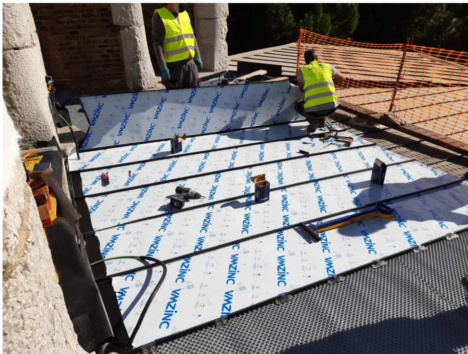
Imatge de l'obra de substitució de la planxa de zinc

Aquesta obra ha tingut un cost total de 26.380,23 euros amb l'IVA inclòs, on també estan inclosos els honoraris de la direcció d'obra i la direcció d'execució d'obra (aparellador).