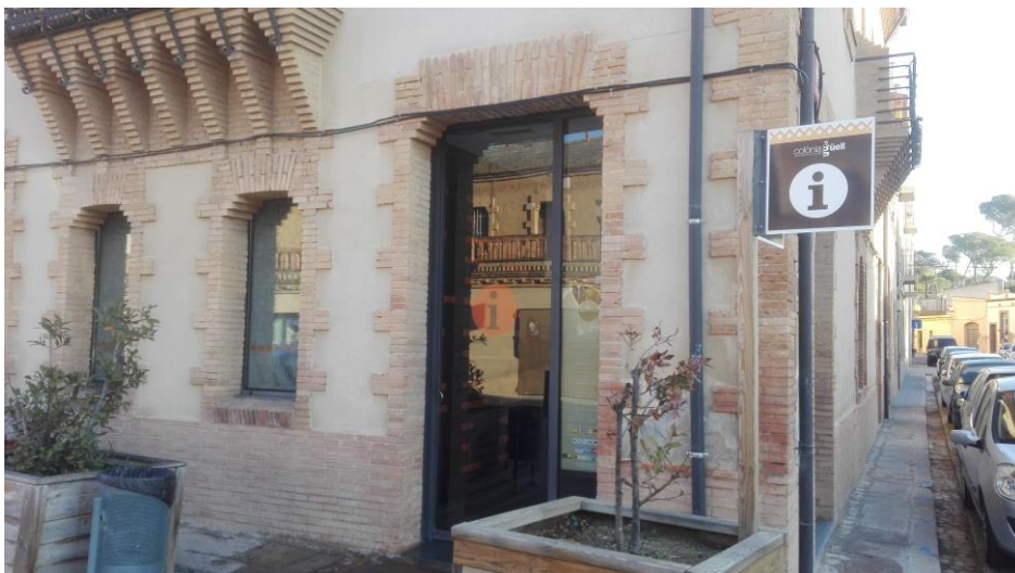
Imatge de l'entrada al Centre d'Interpretació i punt d'informació

El Consorci de la Colònia Güell té una cessió d'ús per part de l'Ajuntament de Santa Coloma de Cervelló, regulada mitjançant un conveni de col·laboració, de l'edifici del Centre d'interpretació i part dels antics cellers, per acollir l'exposició permanent sobre la Colònia Güell i la Cripta de Gaudí, així com ser el punt d'acollida i informació de les persones visitants.