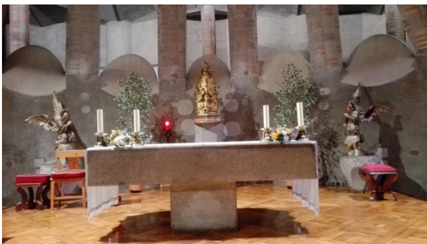
Imatge del Presbiteri i Altar major

Al llarg del 2020 s'ha continuat amb la col·laboració amb la Parròquia del Sagrat Cor per a la realització dels diferents actes litúrgics que aquesta realitza, tal i com recull el conveni de col·laboració vigent amb l'Església Catòlica, que té vigència fins el 7 juliol de 2026.